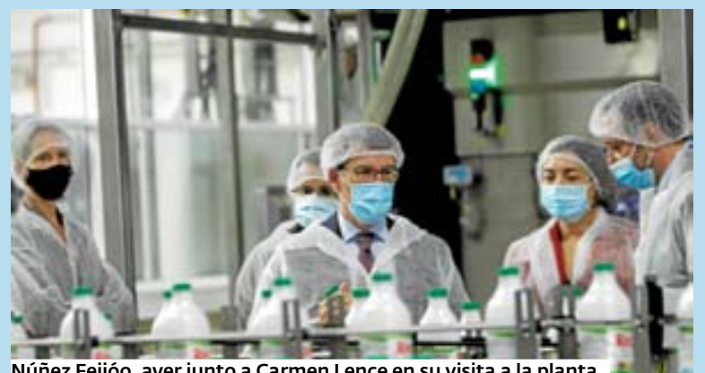
Núñez Feijóo, ayer junto a Carmen Lence en su visita a la planta.

El presidente pone a la firma lucense como ejemplo para el futuro del sector y dice que el reto de Galicia es transformar el 75% de la leche que produce. > 8