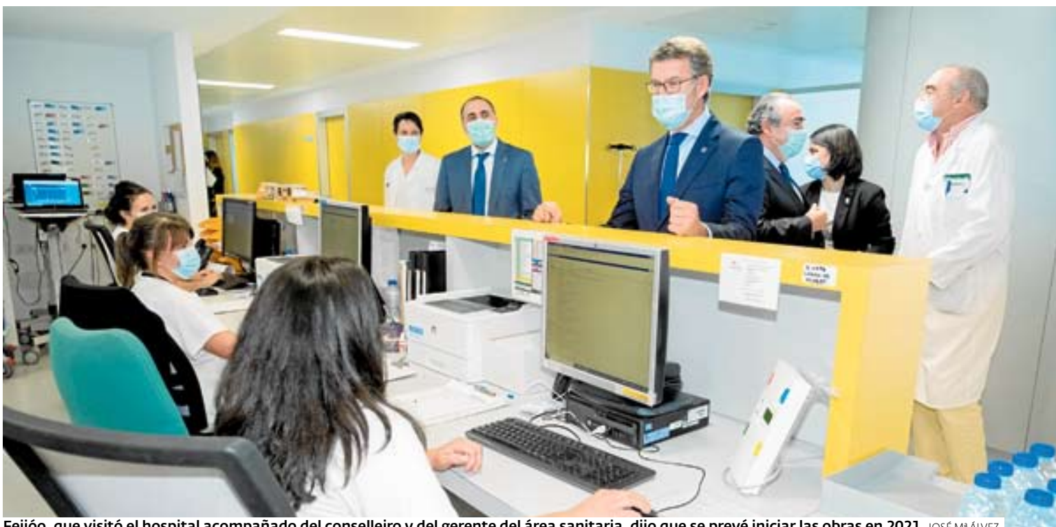
Feijóo, que visitó el hospital acompañado del conselleiro y del gerente del área sanitaria, dijo que se prevé iniciar las obras en 2021. JOSÉ Mª ALVEZ

Estas próximas semanas y los próximos meses van a ser duros, muy duros»