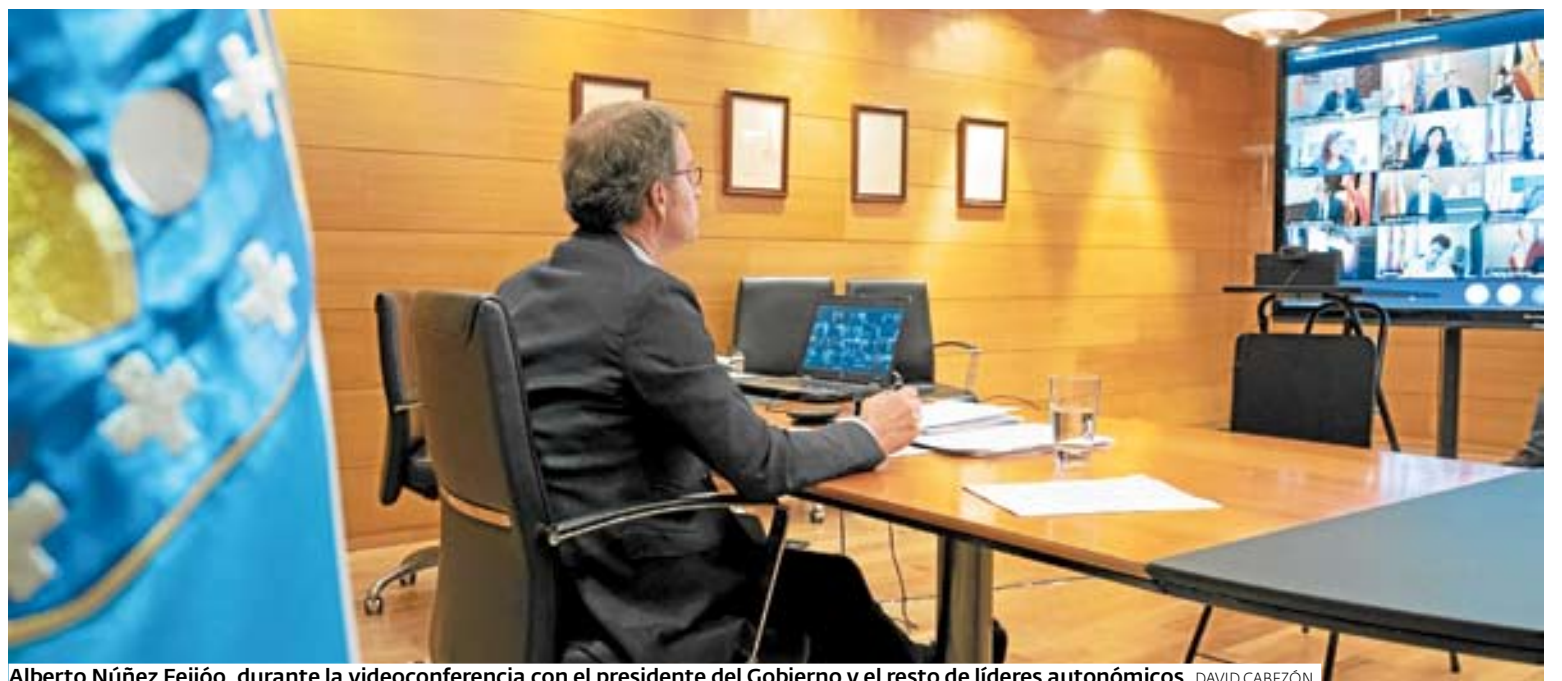
Alberto Núñez Feijóo, durante la videoconferencia con el presidente del Gobierno y el resto de líderes autonómicos.