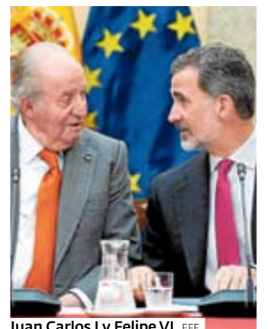
Juan Carlos I y Felipe VI.

El actual monarca aparecía como beneficiario del fondo que recibió su padre de Arabia Saudí a través de dos fundaciones ► Zarzuela dice que supo de la existencia de una de ellas en 2019 por abogados de Corinna Larsen > 59